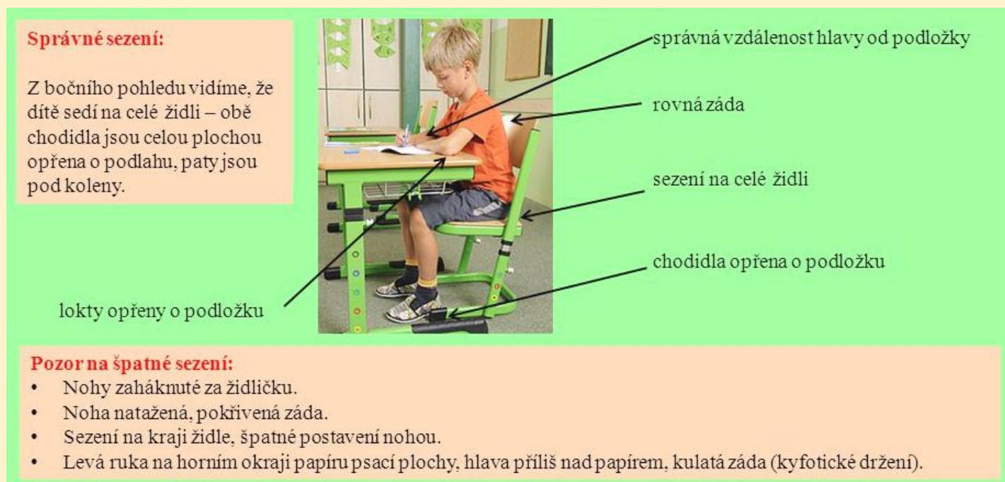
Obr. 2 Správné sezení a držení těla při psaní (Kopčanová)